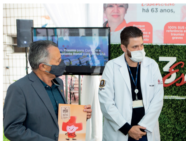
Café da manhã com os diretores do Hospital Universitário Cajuru.