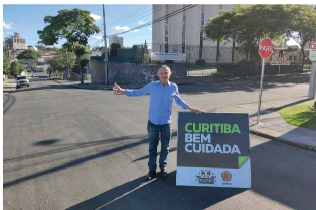
Asfalto na Rua Waldemiro RY, no Novo Mundo.