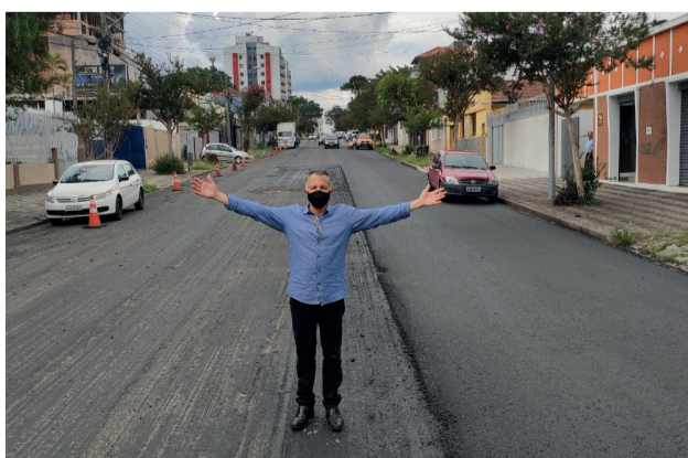
Revitalização da Rua 24 de Maio, no Bairro Rebouças.