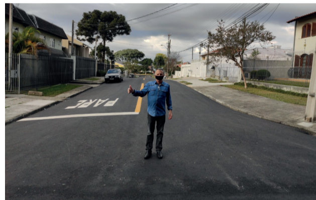
Revitalização da Rua Haiti, no Bairro Guairá.