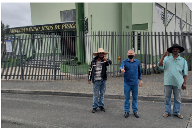
Revitalização na Rua León Tolstói, no Bairro Lindoia.