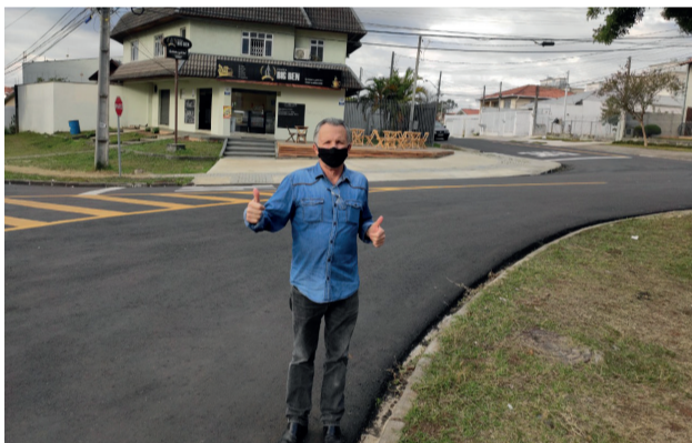
Revitalização da Rua Antero de Quental, no Bairro Guairá.