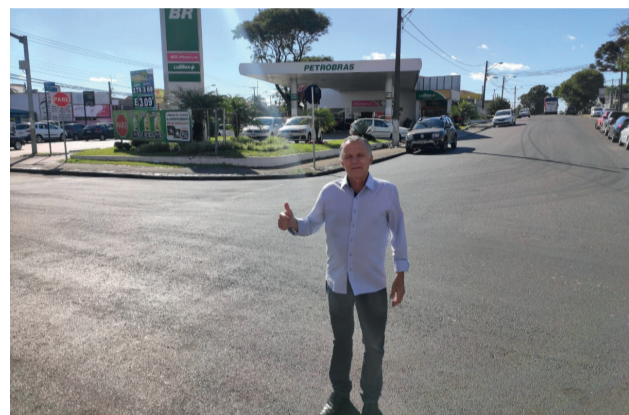
Obras na Rua Adalberto Scherer, no Novo Mundo.