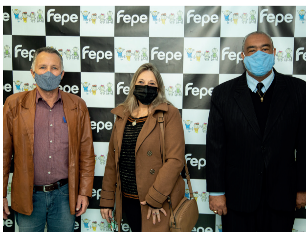
Reunião com a diretoria da Fundação Ecumenica de Proteção ao Excepcional.