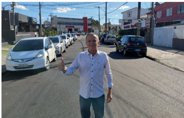
Revitalização Rua Prof. Lício de Lima, no Novo Mundo.