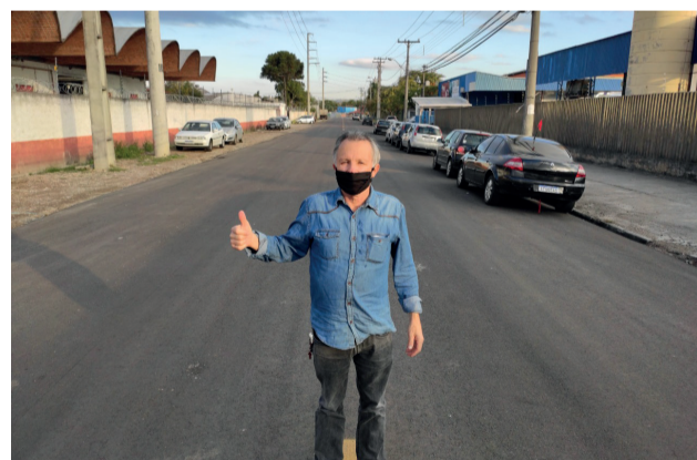
Revitalização da Rua Jackson Figueiredo, no bairro Parolin.