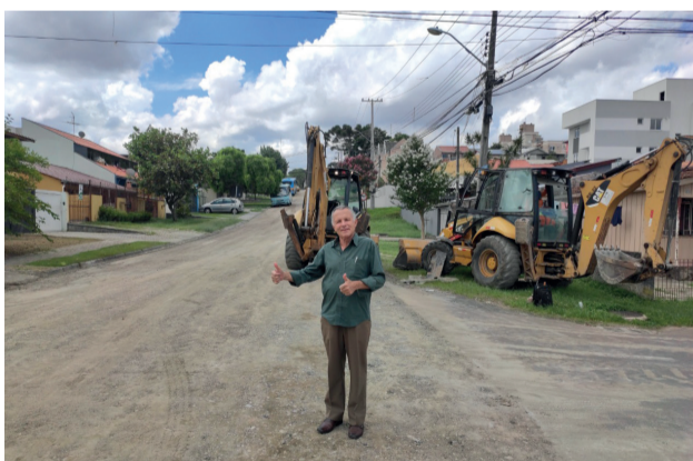
Revitalização da Rua Galileu Galilei, no Bairro Lindoia.