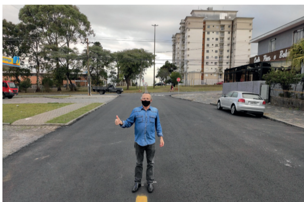
Revitalização da Rua Mem de Sá, no Bairro Guairá.