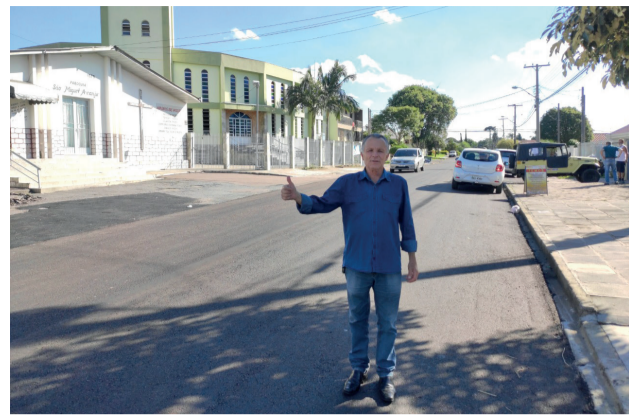
Revitalização na Rua Padre Manuel da Nóbrega.