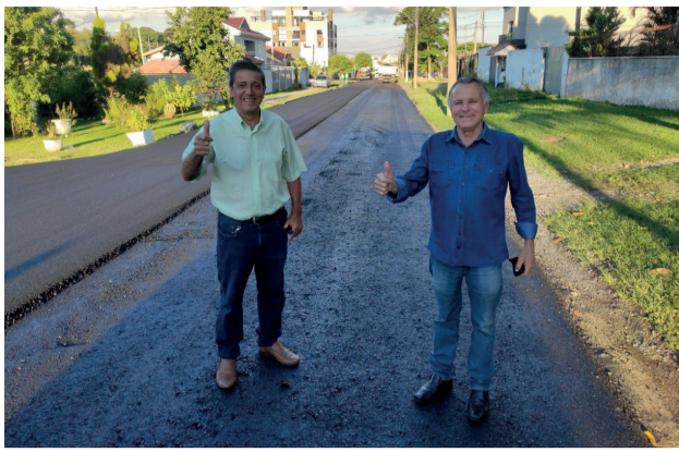
Revitalização na Rua Augusto de Mari, no Bairro Guairá.