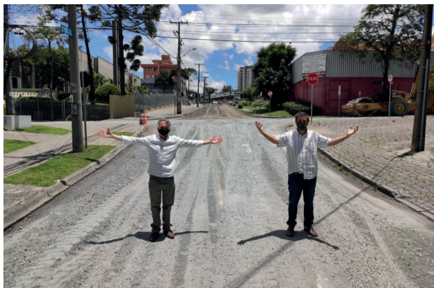
Revitalização asfáltica na Rua Paraíba, no Bairro Guairá.