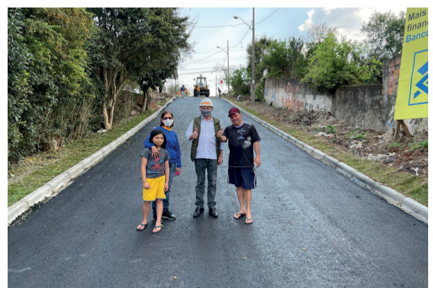
Asfalto na Rua João Maria José de Farias, no Xaxim.