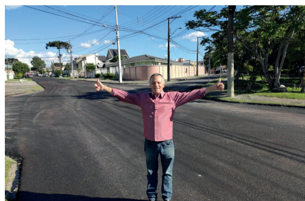
Revitalização da Rua Abel Scuissiato, no Bairro Guairá.