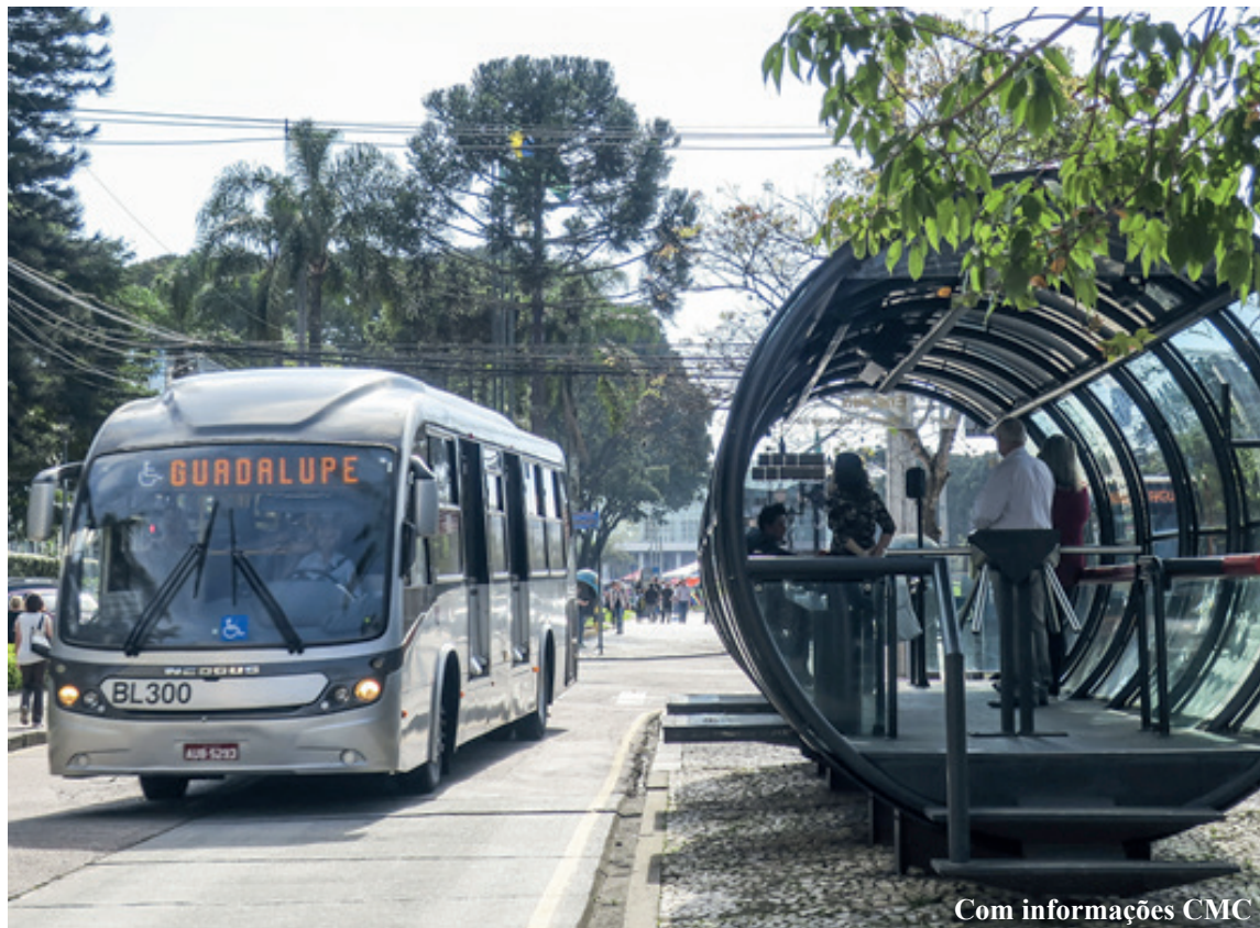
Com informações CMC

Teve início a tramitação de projeto do vereador Oscalino do Povo (Pode) que pretende isentar cegos monoculares do pagamento da tarifa do transporte coletivo (005.00100.2019).